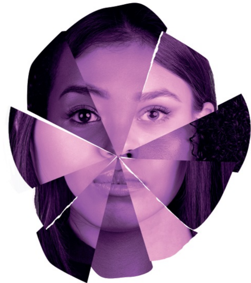
Informe Migradas II Reparación de las violencias de género