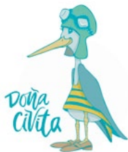
Ilustración: A. Nano Lázaro