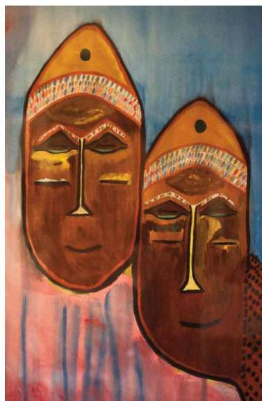
Bailarín. 99x69 cm. Acuarela sobre papel Máscara. 72x57 cm. Acuarela sobre papel El guardian. 69x99 cm. Acuarela sobre papel Mis raíces. 99x69 cm. Acuarela sobre papel