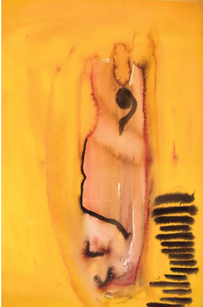
Susurro. 50x70 cm. Acuarela sobre papel