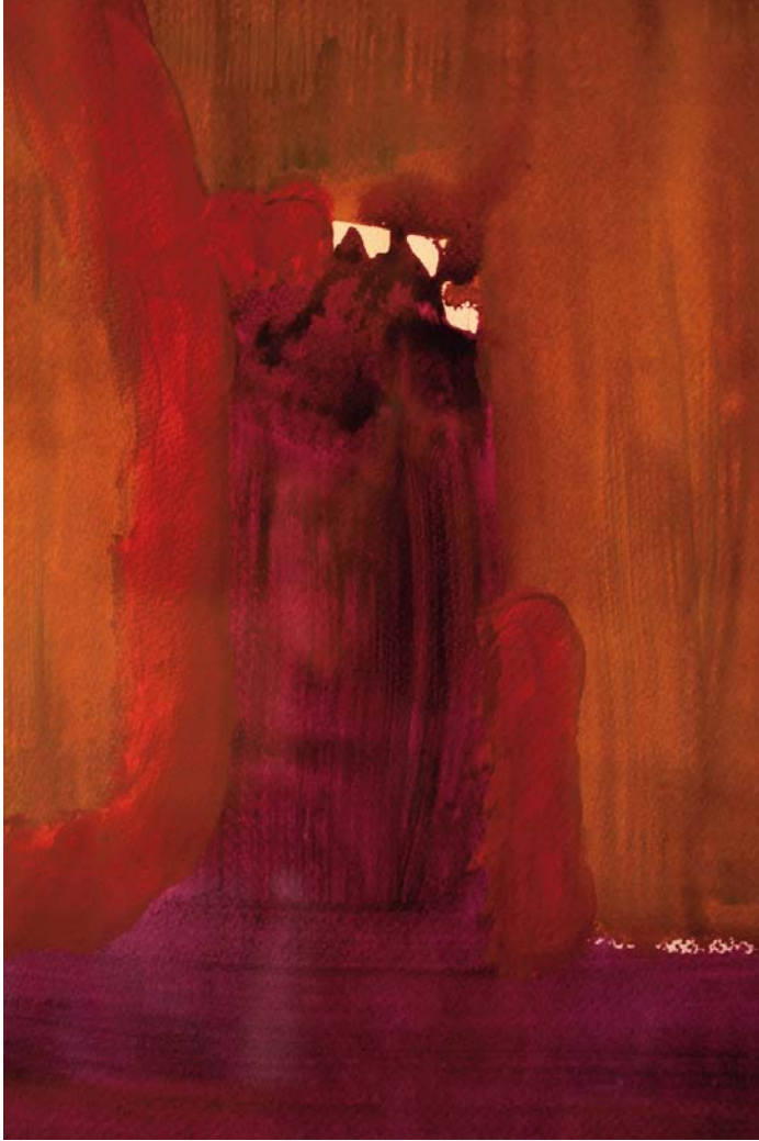
Bienestar. 50x70 cm. Acuarela sobre papel