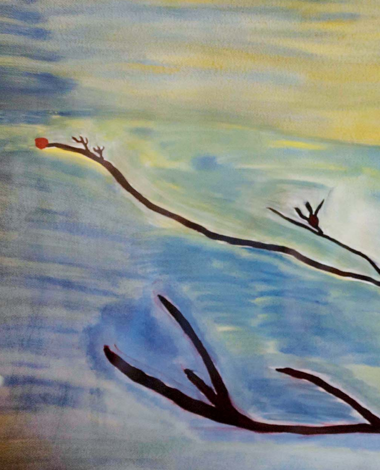
Baobab. 100x69 cm. Acuarela sobre papel