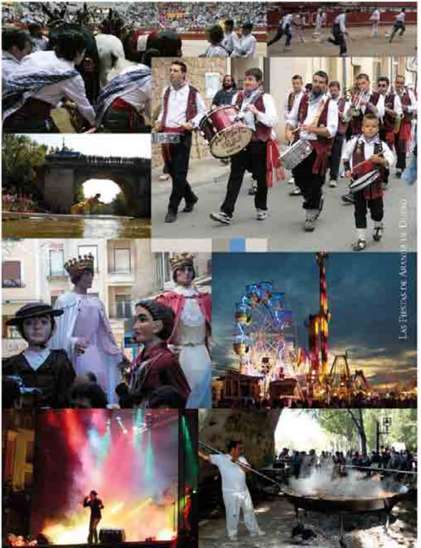
LAS FIESTAS DE ARANDA DE DUERO