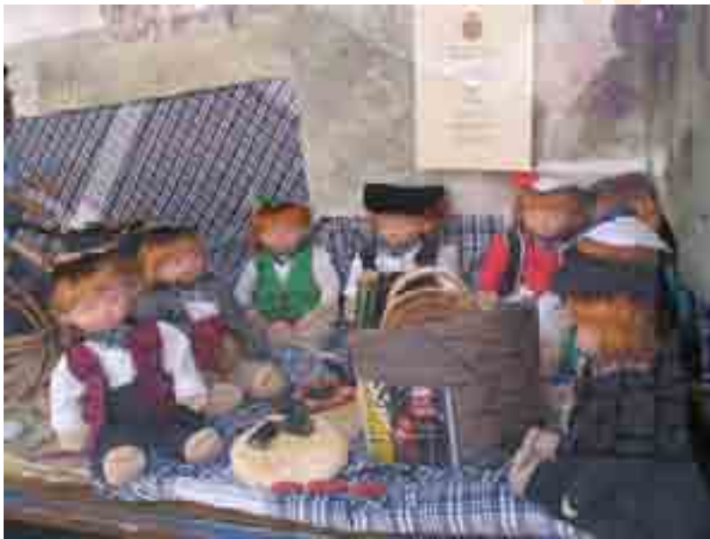
1º EL BOTÓN DE ORO