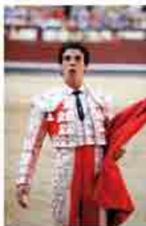
Momento de Aranza

es otro elemento diferenciador de otras plazas, consistiendo en que un jinete al galope da una vuelta al ruedo y recibe las llaves de los toriles lanzadas desde la tribuna por el presidente de la corrida entre los aplausos de los asistentes.