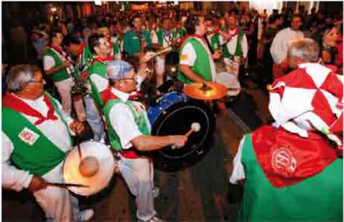
Tradicional bajada de las petras

La Verbena Taurina es una singular actividad que combina lo taurino con lo musical. Los encargados de poner la nota musical son los miembros de las charangas que hacen bailar a los asistentes en el ruedo, hasta que por sorpresa se suelta una vaquilla que hace correr a refugiarse a los danzantes.