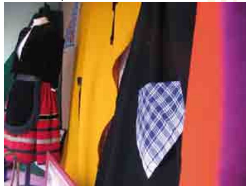
3º TELAS MAYNUR